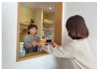
キッチンとリビングをつなぐ小窓

造作洗面台も作業台の高さやL字にしたいという希望を叶えていただきました。他にもリビングの壁紙を白にして空間を広く見せたり、白でも一部違う種類の壁紙にしたりという部分もポイントです。壁紙で言うと、それぞれの部屋にテーマを決めて、黄色やギンガムチェックのアクセントクロスを採用したのもポイントです。