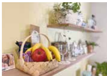
カップボードの上の飾り棚